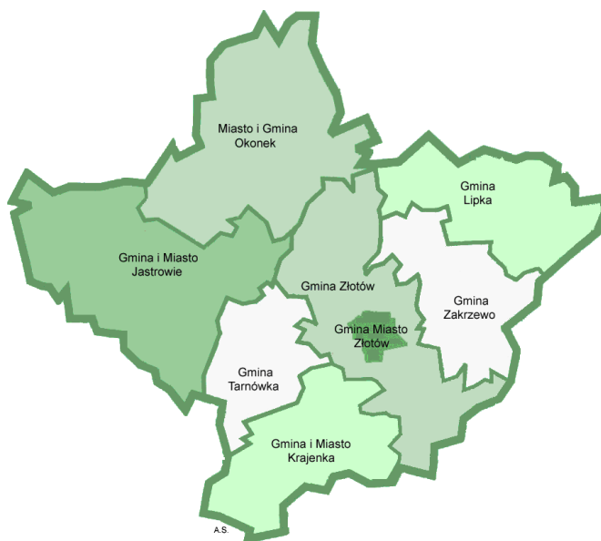
Mapa obszaru LGD Krajna Złotowska

Źródło: Główny Urząd Statystyczny. Stan na 31.XII.2020 r.